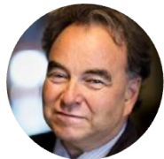
BO ROTHSTEIN är seniorprofessor vid Göteborgs universitet.

Många av dessa ungdomar hamnar i en situation där det inte finns plats för dem på någon utbildning, men de får heller inte något jobb eftersom många arbetsgivare numera ratar sökande utan gymnasieutbildning, även när det gäller mera manuella arbeten. Det hela blir än mer absurt eftersom det i dag finns stor brist på personal inom många hantverks- och serviceyrken och att antalet platser på gymnasieutbildningar till sådana yrken minskat kraftigt. Ett stort antal ungdomar stängs således ute från utbildningar och framtida jobb därför att de saknar godkänt betyg i ämnen som inte har någon betydelse för dessa utbildningar och yrken.